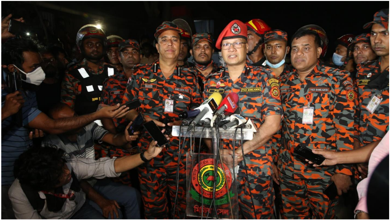
৭। ০৪/০৫/২০২২ খ্রি. বিএম কন্টেইনার, সীতাকুন্ড, চট্টগ্রাম ট্রাজেডি।